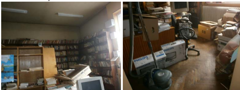
Библиотека- блок "основна училищна сграда"

- По отношение многофункционална зона, сектор "Библиотечно - информационен център"-в сградата е предвидена и изградена библиотека, с помещение читалня, както и книгохранилище, но същите не функционират-помещенията са занемарени и заключени.