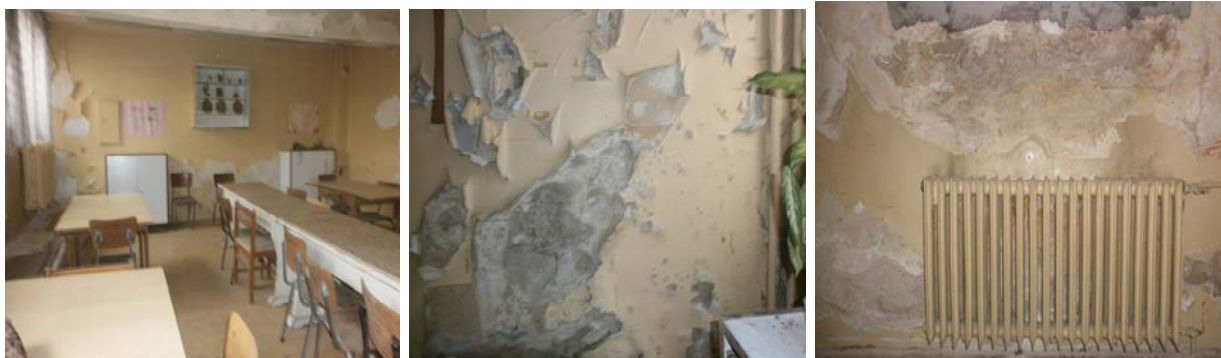
Учебни кабинети в сутерен - блок "основна училищна сграда"

Всичко това е вследствие на липса и неизпълнени или некачествено изпълнени и компрометирани хидроизолации, дренаж, повредени ВиК-инсталации, нарушено външно водоотвеждане от покрив, износени материали, липса на адекватни ремонти и най-вече от просмукване на повърхностните води при външните стени поради пропаднали тротоарни настилки около сградата, на места настилки с обратен -към сградата наклон. Английските дворове към вътрешния двор са неотводнени, при валежи коритата им се пълнят с вода, която няма къде да се оттече, във времето просмуква през стените и ги руши. Пред сутеренните прозорци на голямата сграда, по фасадата към ул. "Ген. Стефан Тошев" са монтирани ниски предпазващи бордове с височина от прилежащата настилка от около 10см. В действителност изградените тротоарна и озеленена площ към уличното платно, между улица и сграда, са на по-високо ниво от плочника до/към сградата и при валежи повърхностните води се събират в ниската зона, няма къде да се отводнят, просмукват, а при по-високи води и преливат през бордовете и текат през и около касите на дограмата. Покривът също се отводнява в ниската зона, върху прилежащия терен а не в канализацията.