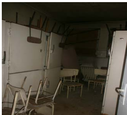
Хладилно помещение към кухненски тракт

- По отношение многофункционална зона, сектор "Извън класни дейности "- сградата е без изградена актова зала /форум/, както и с технически и помощни помещения към нея. Съгласно чл.49 /1/- актова зала се предвижда към училища с повече от 600ученика. По писмена информация на ръководството на учебното заведение към настоящата учебна година учениците са 876. В сутерена, в непосредствена близост до централното стълбище и фойето към него на "основна училищна сграда" е обособена зала за събития "киносалон" с помещение към нея кино кабина и склад за инвентар. Към периода на обследване същите са неизползваеми видимо не отскоро, разбити и в трагично състояние, като причините за състоянието на тези помещения са напълно идентични с причините, поради които не функционират и са необитаеми и останалите сутеренни помещения. Изградения физкултурен салон е със сцена, но без необходимия за събития инвентар и прилежащи помощни помещения.