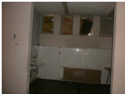
Умивалня към столовата

В действащия към настоящия момент училищен бюфет настилката не е подходяща - от стария тип паркет. Столовата и кухненския блок отговарят на нормите за проектиране, но не отговарят на техническите изисквания за съответствие със съществените изисквания по чл.169 от ЗУТ - помещенията са със счупена и негодна фасадна и вътрешна дограма, със силно износени финишни покрития, с некачествено работещи инсталации и др. В етажното ниво към кухненския блок, както и в сутеренното ниво на това тяло са подsigурени необходимите складови помещения и площи, обслужващи помещения, битови помещения за персонала и пр., но те са в изключително занемарено и неподдържано състояние и не се използват. Не се ползват и други помещения към кухненския блок /подготовки, складови и пр./ поради намаления обем хранещи се към стола.