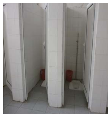
/ремонтирана група WC/