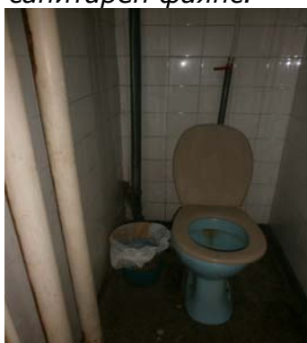
/ WC етаж- към столова /

В предверието /над мивките/ към столовата, както и в топлата кухня, умивалнята и подготовките, на част от складовите кухненски помещения и в санитарните възли към столовата, фаянсовата облицовка е от стария вид плочки, бели с размери 15/15см., преобладаващо в здраво състояние, но без гланц от дългия експлоатационен период, с морално остаряла визия, с опадала фугировка, с напуквания от различен характер, с износен санитарен фаянс, допълнително изтеглена тръбна разводка /външно, пред фаянса/, с неработеща и счупена на места арматура и др. Причина - износване на материалите, дълъг експлоатационен период и др. Част от санитарните помещения /тези, които все още не са ремонтирани/, както и облицовката в кабинета по готварство са също със стария вид облицовка, която е в нехигиеничен и нелицеприятен вид, с липсващи плочки, с изпочупени ъгли и плочки, с изцяло опадала фугировка, захабена, с променен цвят, със следи от ръжда, мръсна и с наслоявания, със счупена и негодна арматура и санитарен фаянс.