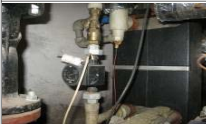
Топлообменник с ЦП за БГВ