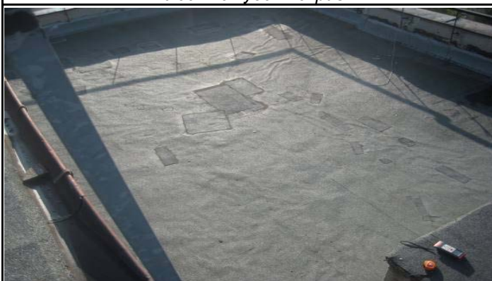
Плосък студен покрив